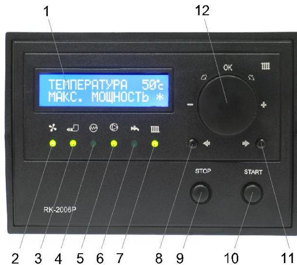
Рис. 1. Передняя панель контроллера RK-2006LP.